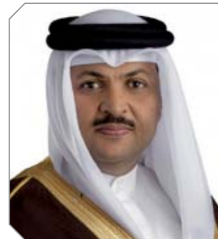
وكيل وزارة شؤون الإعلام

ونوه وكيل وزارة شؤون الإعلام نائب راعي الملتقى، إلى أهمية هذا المنتدى الإعلامي في ظل ما تتعرض له أمتنا العربية من استهداف لهويتها الثقافية والحضارية، وتهديدات لأمنها القومي من أعمال