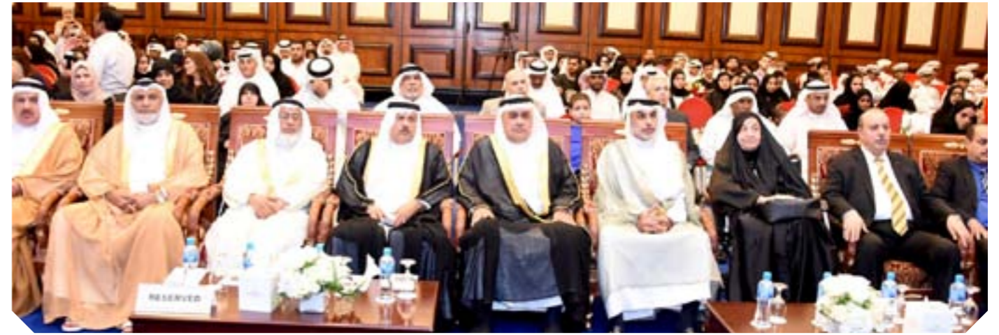
جانب من ضيوف الجامعة الخليجية في حفل تخرج الفوج الثاني عشر من طلبتها