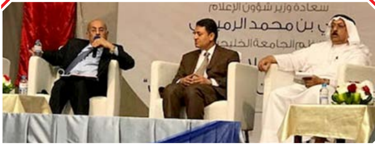
د. مفيد شهاب وزير التعليم العالي المصري السابق أثناء لقاء محاضراته في المؤتمر

البحرين واعتزازها بالمواقف الإعلامية الخليجية والعربية المشرفة في دعمها لأمنها واستقرارها، ومساندتها لمسيرتها التنموية والديمقراطية، وتضامنها مع التحالف العربي بقيادة المملكة العربية السعودية الشقيقة لترسيخ الشرعية في اليمن ومحاربة الإرهاب، ورفض التدخلات الخارجية في شؤوننا الداخلية.