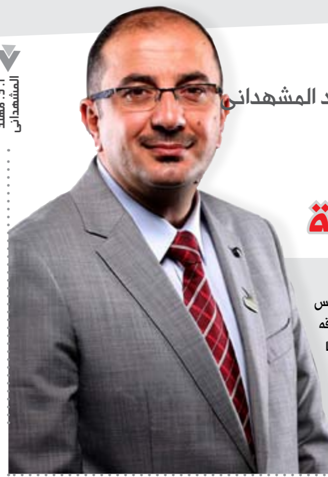
المشهداني أ. د. مهند

توجهنا كطلاب مقرر الكتابة للعلاقات العامة إلى مكتب رئيس الجامعة الخليجية والذي يعرف عنه بالمرونة وحبه للطلاب وعشقه للجامعة الخليجية للتعرف على نشاطات الجامعة وأهدافها فعلى الفور رحب بهذا اللقاء وعرض تاريخ الجامعة وكلياتها وأقسامها المختلفة، فوجدناه شخصاً محملاً بالأفكار والحماس ولديه تحد وإصرار على تغيير المنظومة الجامعية ووضعها في مستوى متميز فكان هذا الحوار: