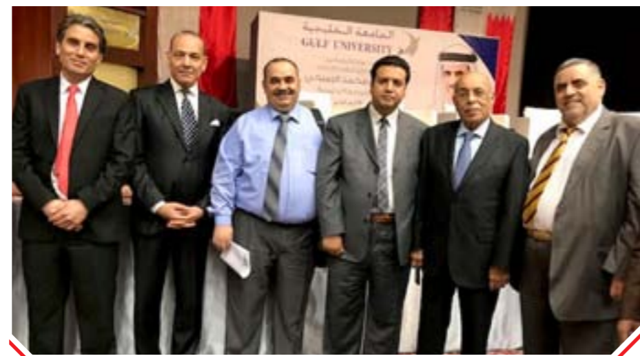
صورة تذكارية لأعضاء هيئة التدريس مع ضيوف الملتقى

عنف وإرهاب، وتنامي خطابات الكراهية، وتدخلات خارجية في شؤونها الداخلية تسعى إلى زعزعة استقرارها، وتشويه صورتها، وجرها إلى حروب طائفية أو طمس ملامح الدولة المدنية الحديثة، وتأثيراتها على المسيرة التنموية. وشدد على أن هذه التحديات تفرض على جميع وسائل الإعلام تحمل مسؤولياتها القومية والأخلاقية، من خلال احترامها لآداب المهنة، والتزامها بالتشريعات والمواثيق الإعلامية في تحري الدقة والموضوعية والأمانة، وحفاظها على الهوية الثقافية، ودعم التنمية المستدامة، ونشر قيم التسامح والوسطية، وتعميق روح المواطنة، ونبذ الدعوات المثيرة للكراهية الدينية أو الطائفية أو العنصرية أو المحرصة على التطرف والإرهاب؛ فضلاً عن توضيح الحقائق في مواجهة حملات