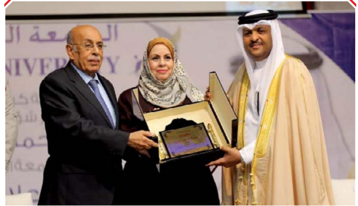
الجامعة الخليجية تكرم وكيل وزارة الإعلام في الملتقى الإعلامي