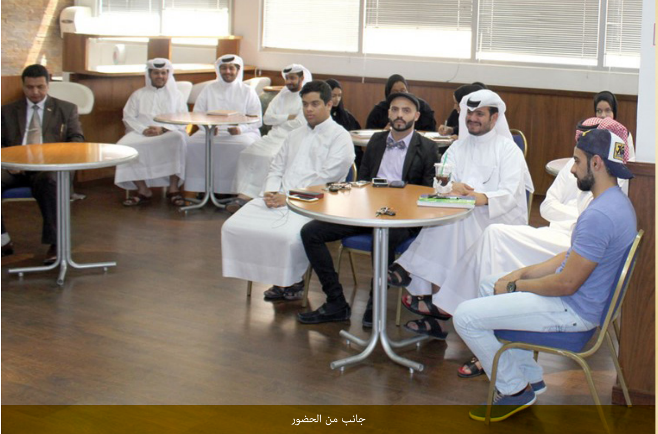
جانب من الحضور

وأضاف حارص أن مبادرة وزارة الإعلام والجامعة الخليجية وضعت العلاقة بين التدريب الإعلامي وممارسته موضع التنفيذ، وصنعت مفهوماً متقدماً لمستويات التدريب الإعلامي الذي يشكو منه الطلاب والأساتذة بكل الجامعات العربية، واثاحت للطلاب فرص عمل واعدة ومضمونة تحتاج لوساطات قوية من شخصيات وجهات عليا في بلدان اخرى، مؤكداً أنه ليس مطلوباً من الطالب مهارات معينة للقيام بهذا العمل بقدر ما يتوفر لديه الرغبة والاستعداد والاعتماد على خبرات