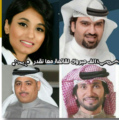
الف مبروك لثانئة معا نقدر

وانتهاء بعمليات الفرز والتدقيق، لافتاً إلى أن العملية الانتخابية لهذه الدورة سارت بكل شفافية ويسر ولم تتلقى الجامعة اية طعون أو شكاوي من النتائج المعلنة. وهنأ المشهداني الفائزين في انتخابات مجلس الطلبة ودعا الذين لم يحالفهم الحظ التعاون مع زملائهم وتزويدهم بالأفكار والبرامج التي كانوا يتمنون تحقيقها في المجلس، مُشيراً إلى أن هذه التجربة تستهدف تزويد الطلبة في هذه المرحلة العمرية بأصول الممارسة الديمقراطية والانخراط في الحياة العامة بكل ثقة واقتدار. ووعد المشهداني بضرورة دعم إدارة الجامعة لمجلس الطلبة وتيسير مهامه عليه حتى يساهم في تطوير الحياة الطلابية ويصبح شريكا فاعلاً في كثير من السياسات والقرارات المهمة التي تتخذها الجامعة سواء في سير العملية التعليمية وتطويرها وتفعيل العلاقة الطلابية مع اساتذة الجامعة وكافة الإدارات والقسم التي تقوم على خدمتهم.