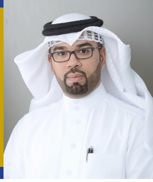
محمد قاسم رئيس الاتحاد الاسيوي للصحافة الخليجية