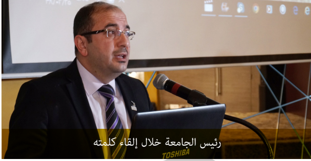
رئيس الجامعة خلال إلقاء كلمته