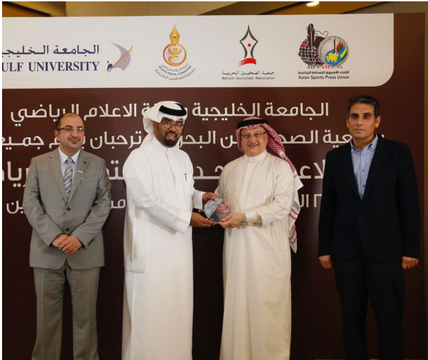
رئيس الاتحاد الآسيوي للصحافة الرياضية خلال تكريمه