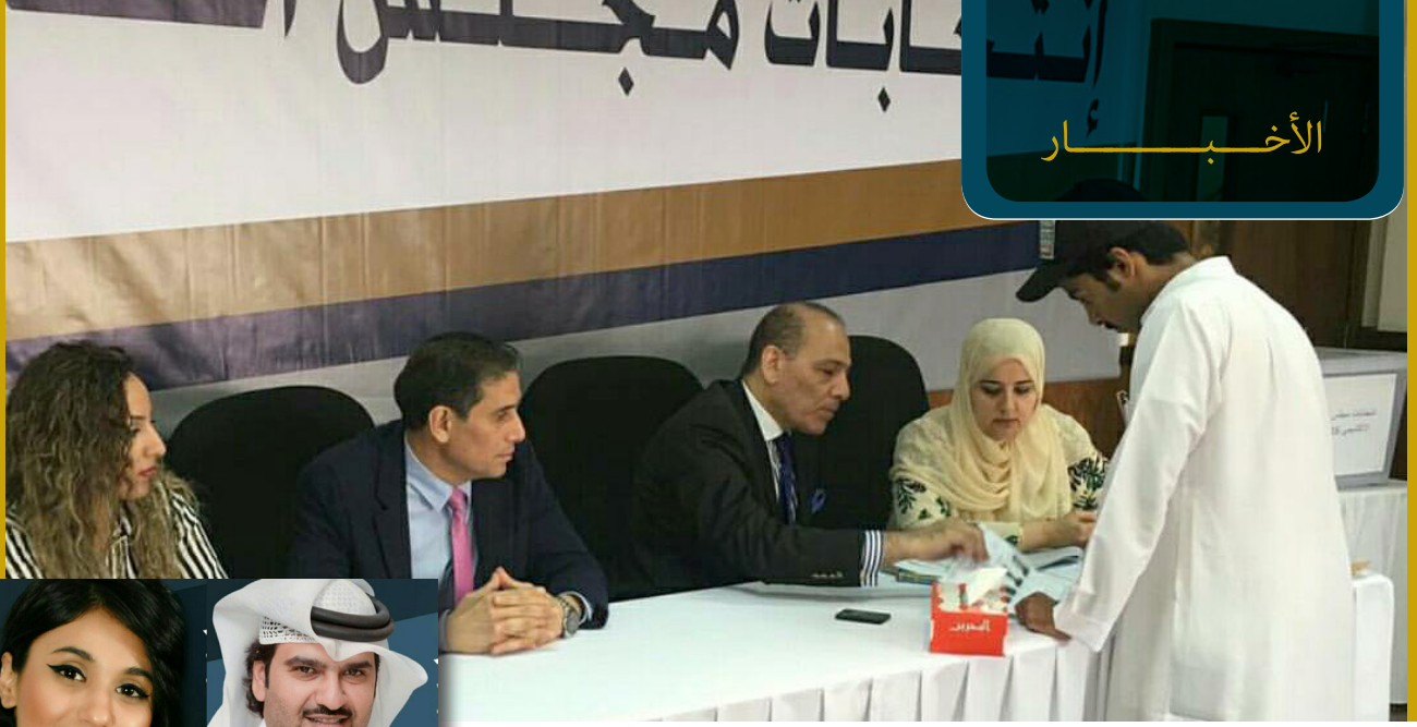
جانب من عملية الإقتراع