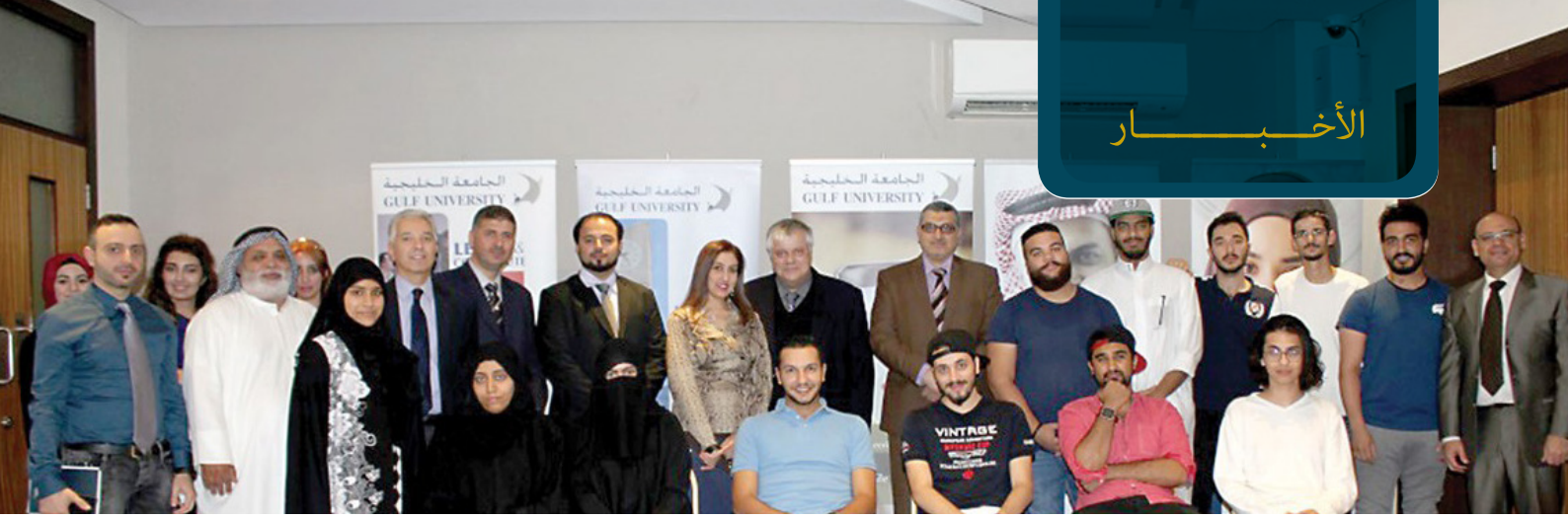
هاوزر متوسطا الكادر التعليمي وطلاب كلية الهندسة

في العمارة والتصميم الداخلي: هاوزر الأمريكي يشيد بدناميكية طلاب الخليجية في التفاعل مع سوق العمل والجامعة تؤكد على تطوير الذات والعمل الجماعي وزيادة الاستديوهات