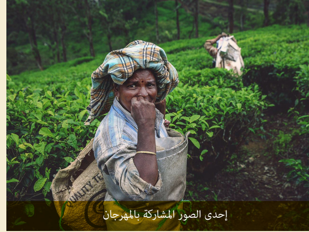
إحدى الصور المشاركة بالمهرجان

ومن المؤكد أن هذه المشاركة جاءت من حرص الجامعة الخليجية على دعم طلابها الموهوبين وتفجير طاقاتهم ودعمها منها على اطلاع الطلبة المتميزين على تجارب المصورين العالميين والاستفادة من الاطلاع على اخر المستجدات في عالم التصوير الفوتوغرافي.