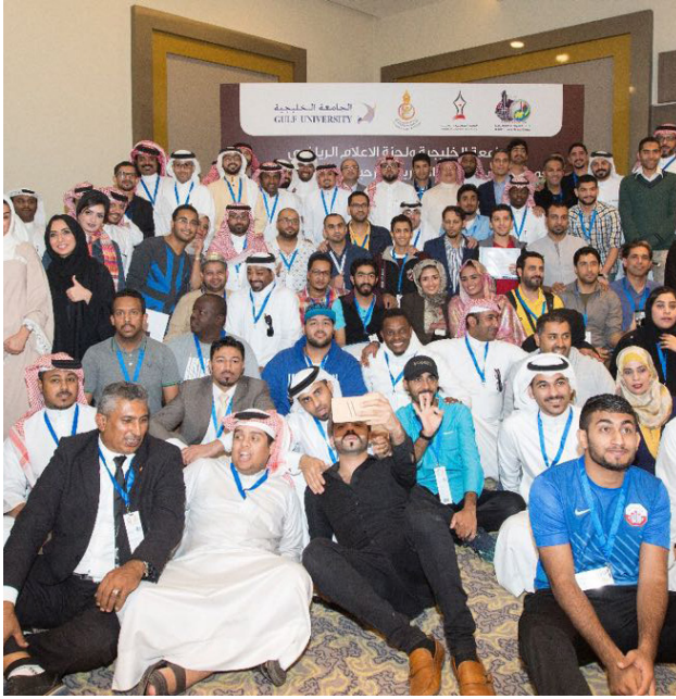
الإعلاميون المشاركون بالدورة