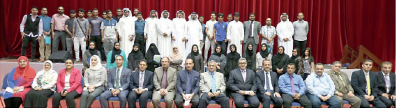
قيادات الجامعة مع الطلاب الجدد