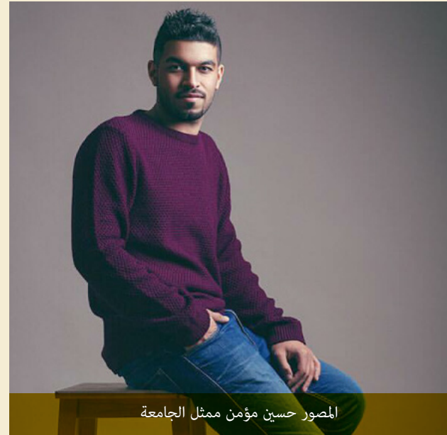
المصور حسين مؤمن ممثل الجامعة