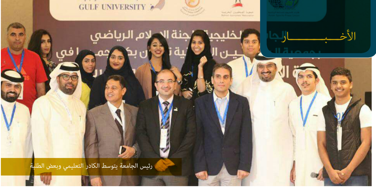
رئيس الجامعة يتوسط الكادر التعليمي وبعض الطلبة