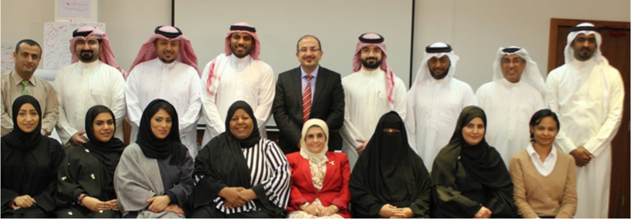
رئيس الجامعة وعميدة كلية العلوم الإدارية يتوسطان متدربي شؤون الجنسية والجوازات مع قيادات الجامعة