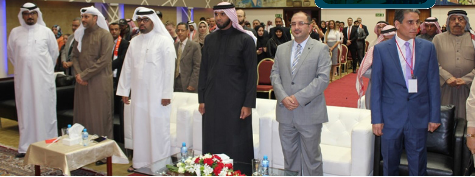
الشيخ علي بن خليفة آل خليفة وعلى يساره رئيس الجامعة د. مهند المشهداني خلال النشيد الوطني